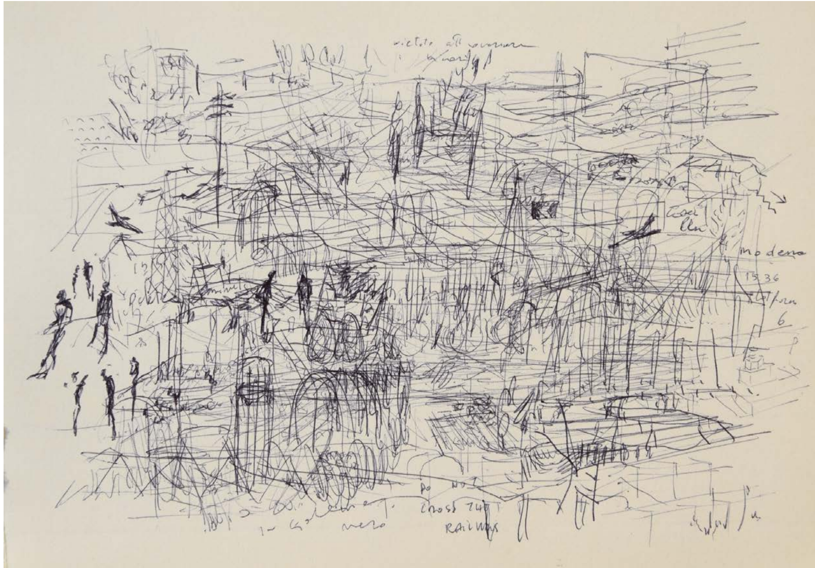
Federico Branchetti Paesaggio da Reggio Emilia a Bologna in treno, 70 km in 45 minuti, 2020 Pen on paper 20 × 13 cm / 7.8 × 5.1 in.