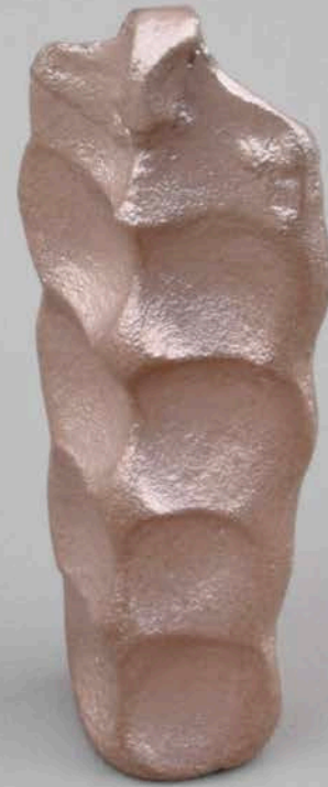
Federico Branchetti Adamah , 2024 Casted bronze 1 and 8 cm / 0.39 and 3.1 in. Ph. Federico Branchetti