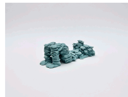
Federico Branchetti Bagnanti , 2024 Green semi-refractory terracotta Max 19,5 cm / Max 6.5 in.