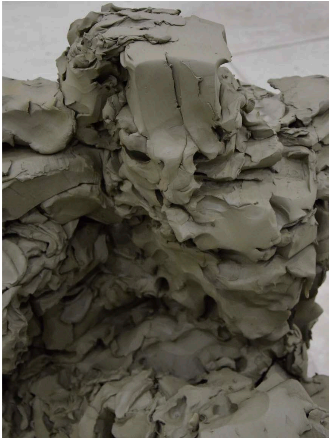
Federico Branchetti L'uomo del Fiume , 2023 Unfired clay 80 × 75 × 70 cm / 31.4 × 29.5 × 27.5 in.