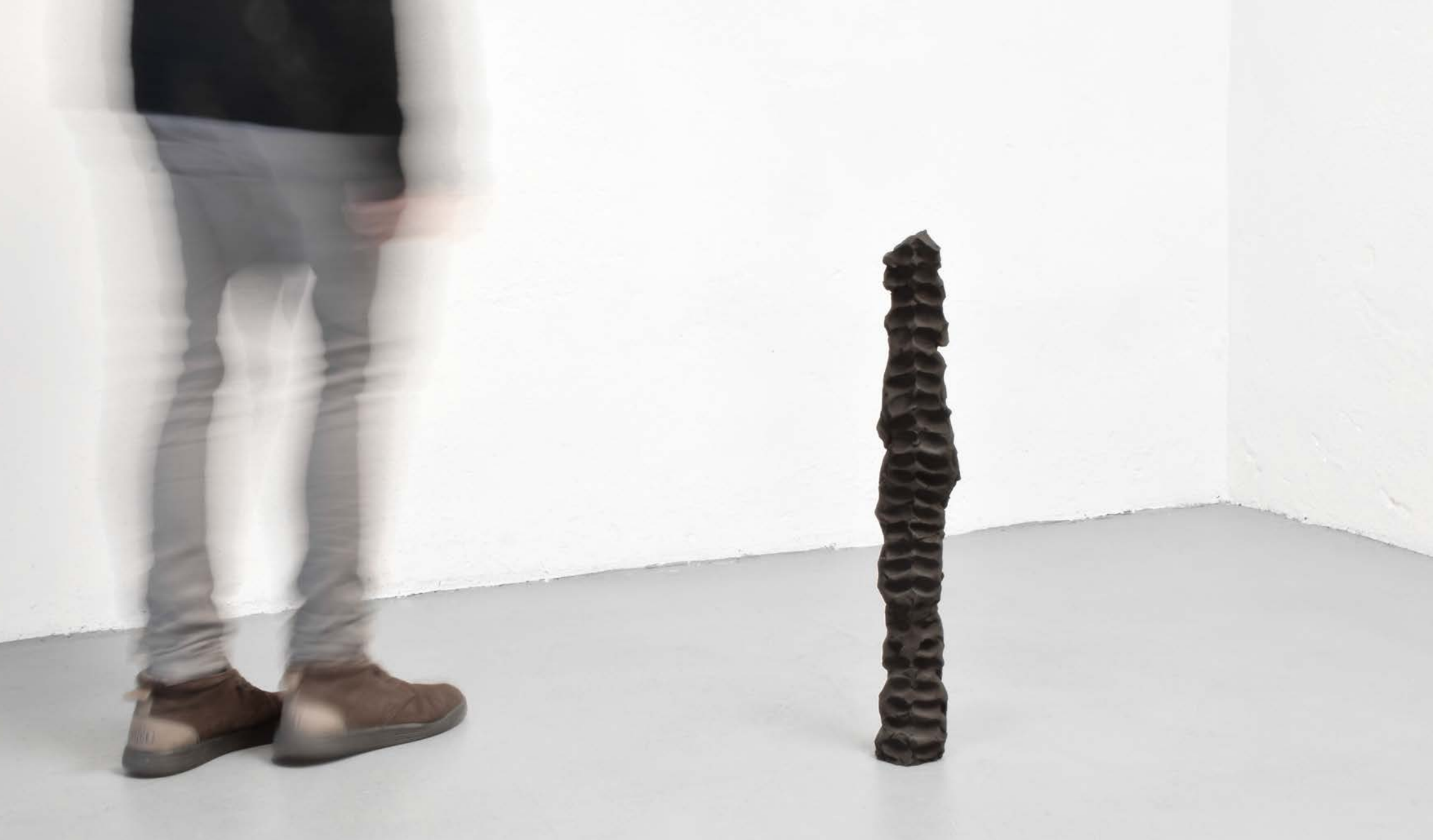
Federico Branchetti Terra promessa , 2018 Casted bronze 68,5 × 10 × 6,5 cm / 26.9 × 3.9 × 2.5 in.