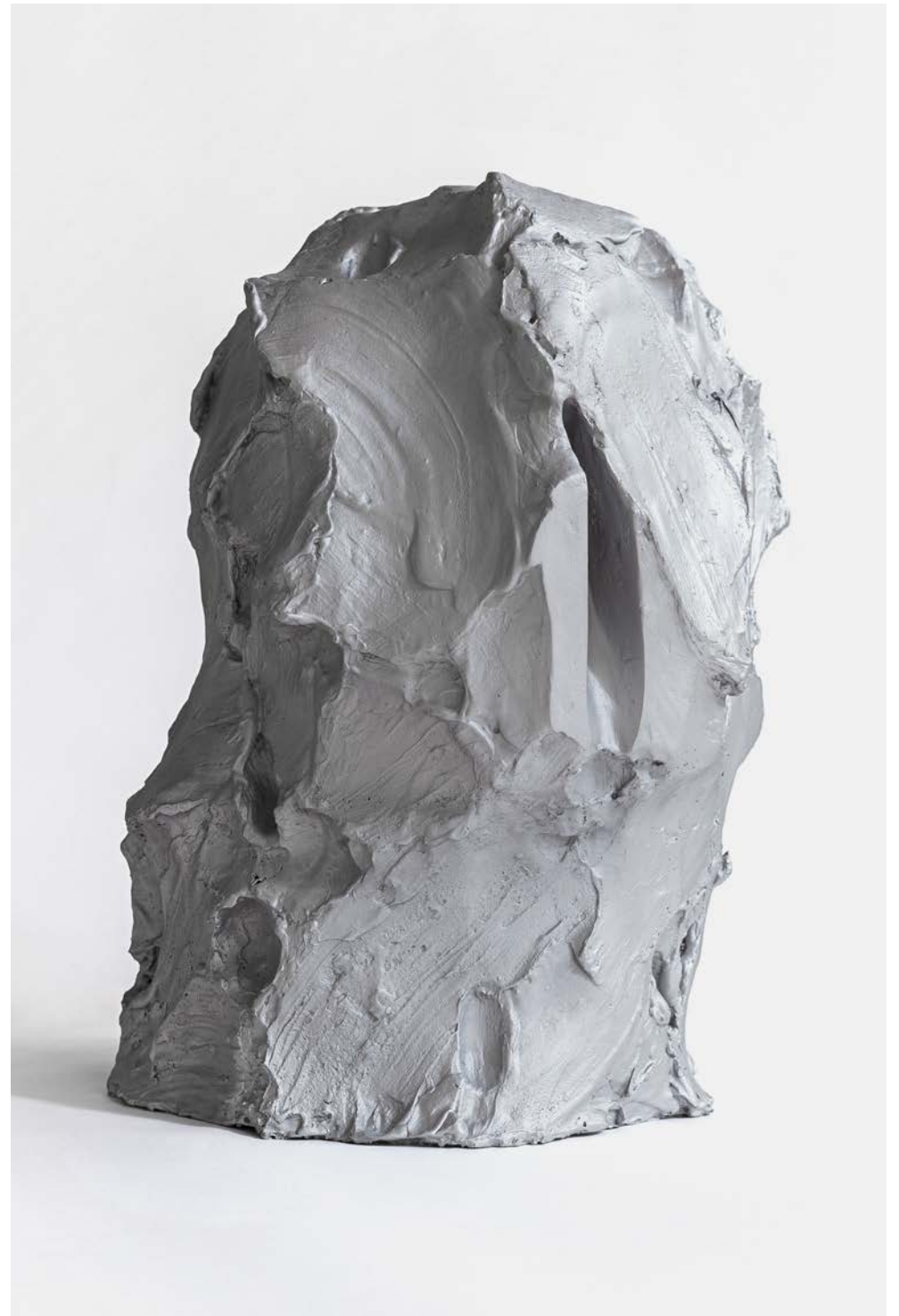
Federico Branchetti Ritratto per una Stella (Gargantua) , 2021 Casted aluminum and empty space 50 × 30 × 36 cm / 19.6 × 11.8 × 14.1 in.