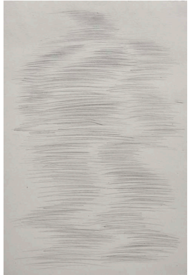
Federico Branchetti Liminale #4,5,6 , 2025 Pencil on paper 25 × 35 cm / 9.8 × 13.7 in.