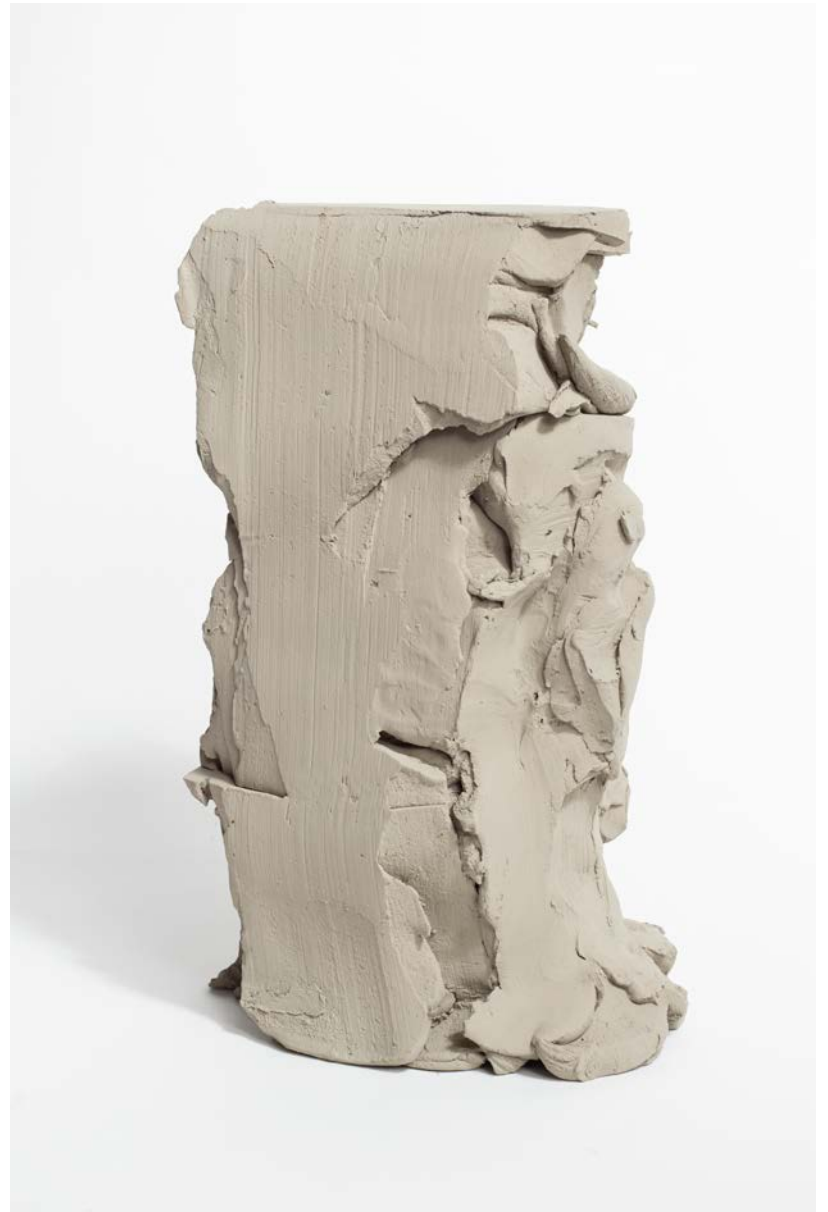
Federico Branchetti Atlas (I/IV) , 2023 Painted Terracotta 35,5 × 20,5 × 17,5 cm / 13.9 × 8.0 × 6.8 in.