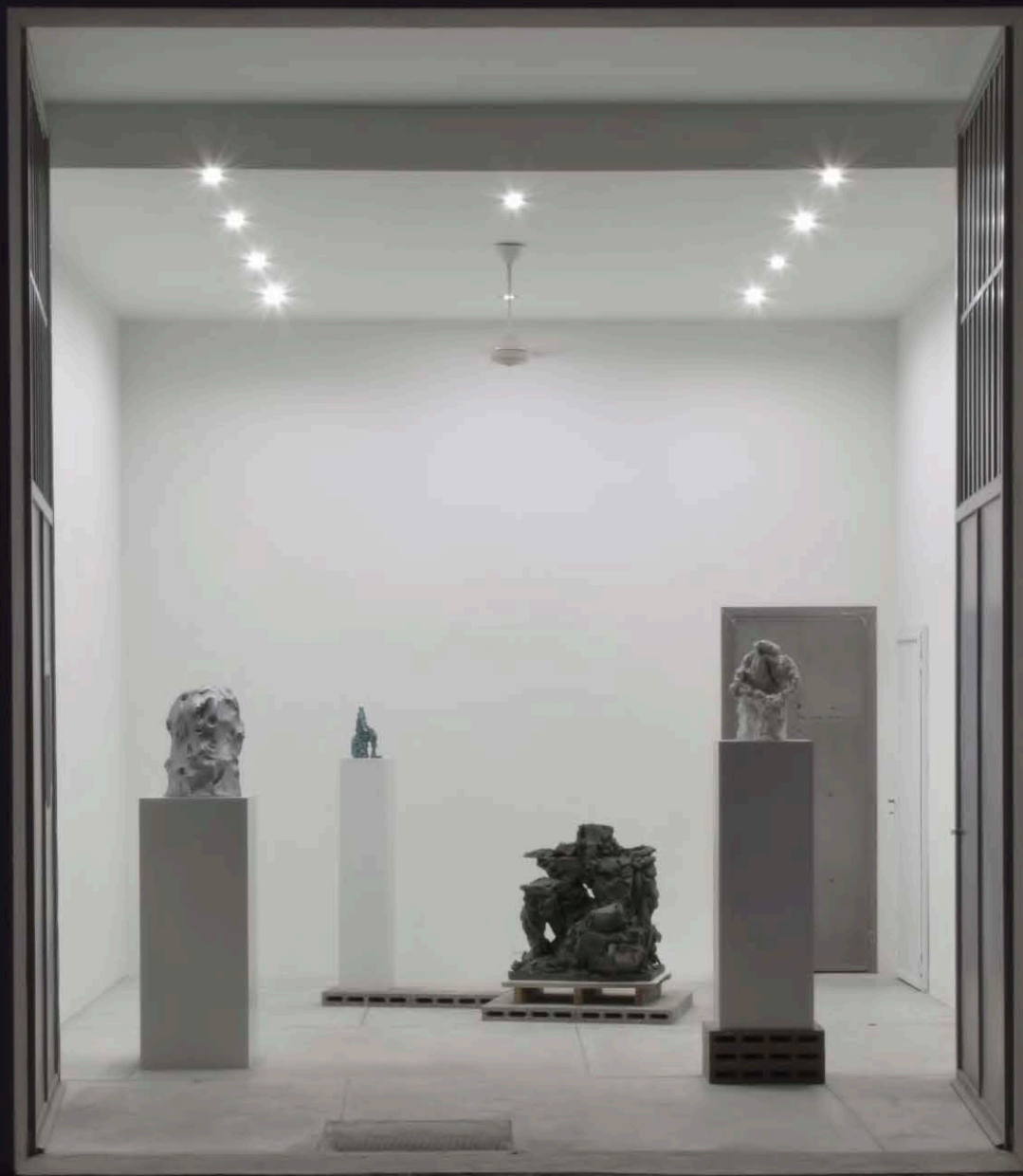
Installation view, Federico Branchetti: Eridano , Galleria ME Vannucci, Pistoia, 2023