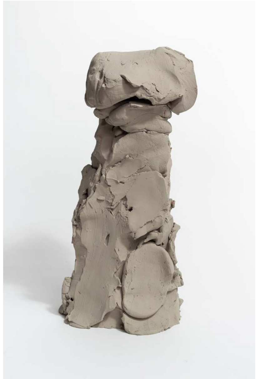
Federico Branchetti Atlas (II/IV) , 2023 Painted Terracotta 38,0 × 18,0 × 16,0 cm / 14.9 × 7.0 × 6.2 in.