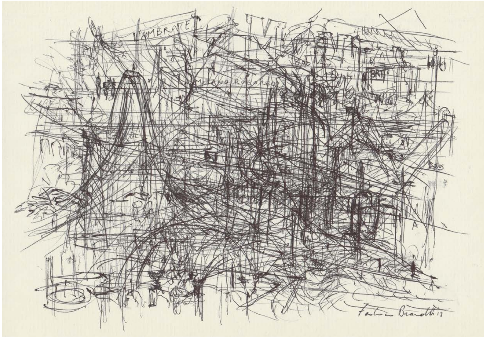
Federico Branchetti Paesaggio da Reggio Emilia a Milano, 146 km in 51 minuti, penna su carta, 2020 Pen on paper 20 × 13 cm