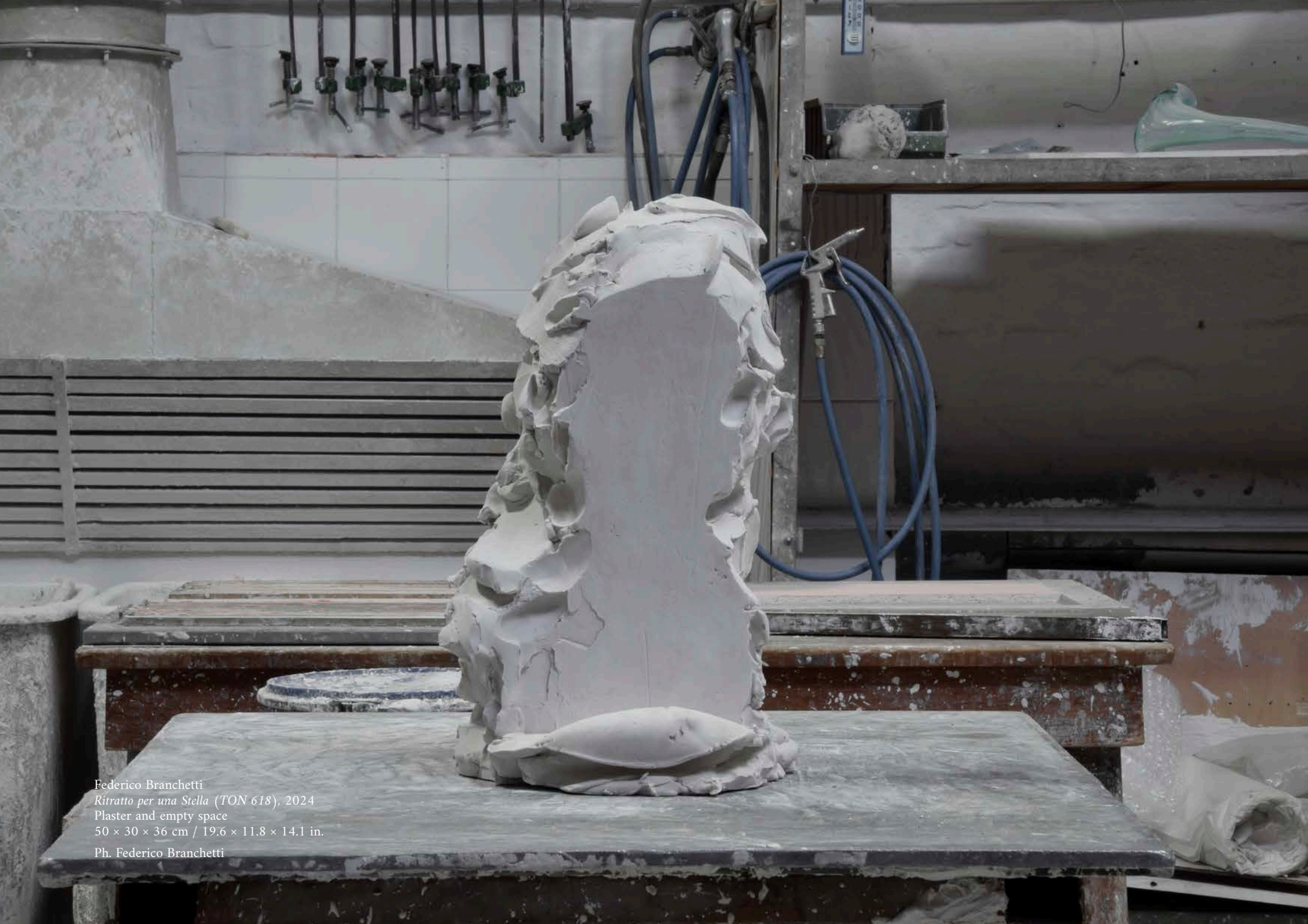
Federico Branchetti Ritratto per una Stella (TON 618) , 2024 Plaster and empty space 50 × 30 × 36 cm / 19.6 × 11.8 × 14.1 in.