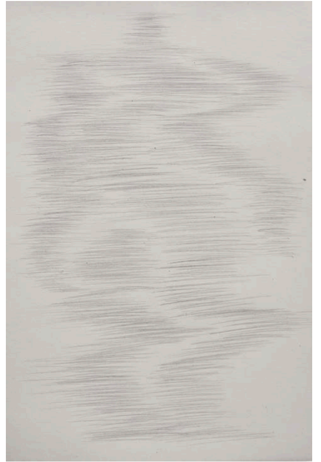
Federico Branchetti Liminale #1,2,3 , 2025 Pencil on paper 25 × 35 cm / 9.8 × 13.7 in.