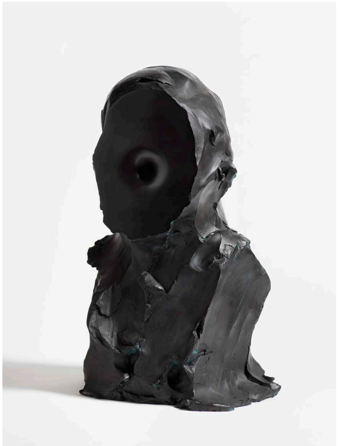
Federico Branchetti Ritratto per una Stella (M87) , 2020 Casted bronze and empty space 48 × 30 × 25 cm / 18.8 × 11.8 × 9.8 in.