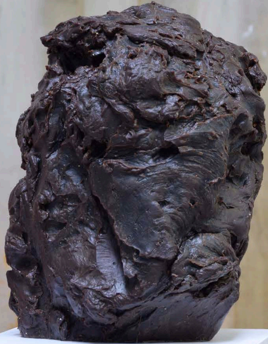
Federico Branchetti Testa , 2025 Wax 30 × 20 × 24 cm / 11.8 × 7.8 × 9.4 in.